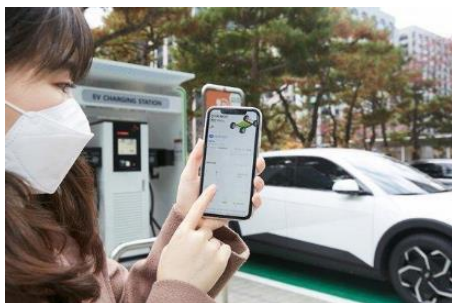
SK Inc. 소프트웨어 Series-A 80억 투자 참여 및 SKO와 EV 배터리 진단 서비스 개발 협업