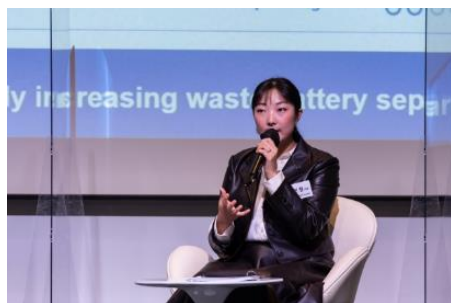
SKIET 배터리 폐 분리막 샘플 공급 통한 소재 개발 및 SOVAC IR Room 출연, Seed 투자유치 완료