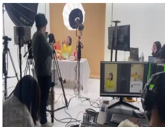
[ PoC 기획/수행 ]