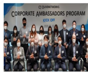
[ CJ Ambassador ]