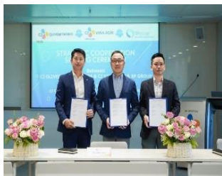
[ CJ ONS 해외법인 ]