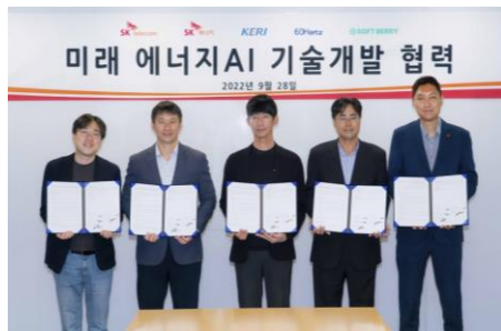
SKE·SKT·전기연·식스티헤르츠·소프트베리, 가상 발전소 기술 개발 협업 (’22년 9월 MOU 체결)