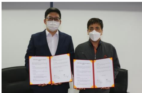
SKIPC·엘디카본 타이어 열분해 및 잔재물 처리 관련 협업 (’22년 4월 MOU 체결)