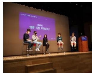
[ Tech-Con ]